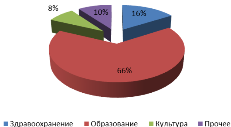
Рисунок 1 – Договоры ГЧП в секторах экономики за 2021 год [3]